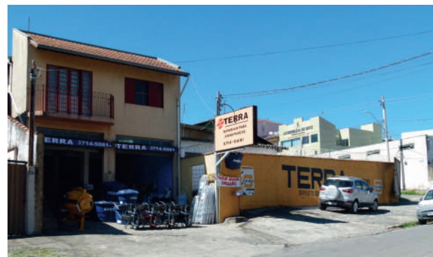
A loja Terra Materiais de Construção, no Jd. Philadelphia