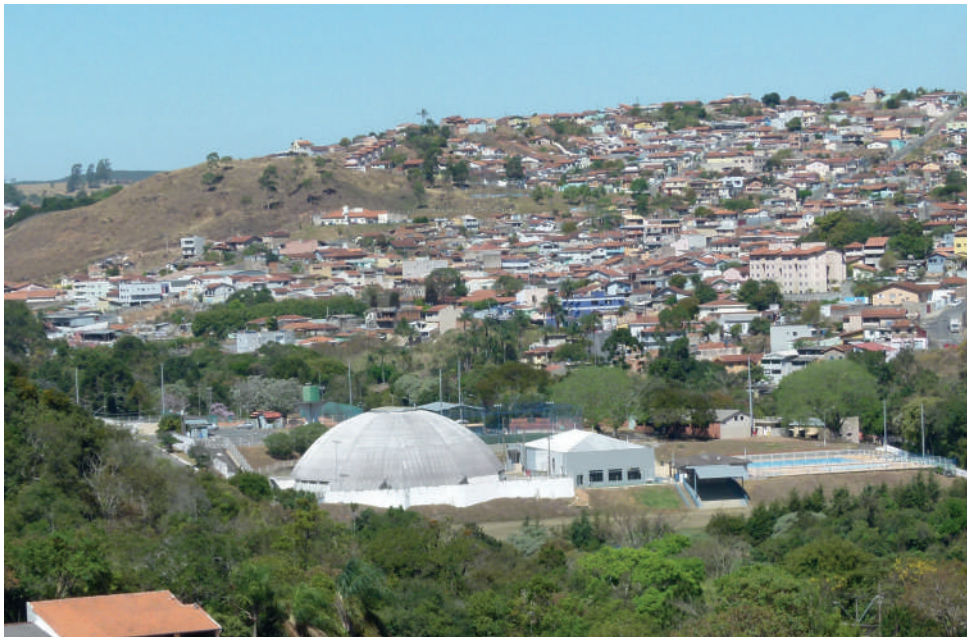
O Clube da Alcoa é um ponto de referência na Zona Leste de Poços de Caldas