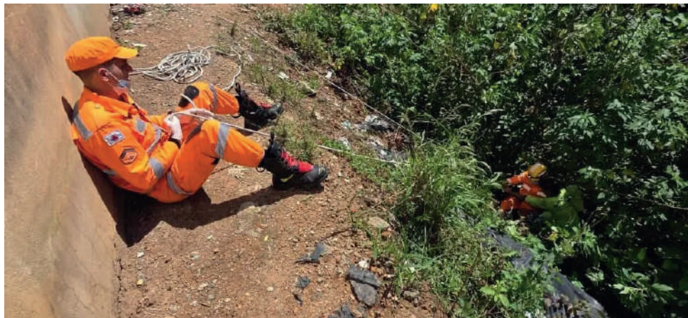
Bombeiros precisaram utilizar técnicas de rapel para salvar a vítima que caiu do barranco