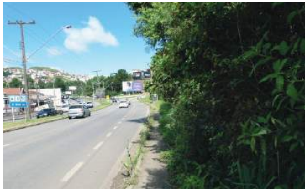
O trânsito é cada vez mais intenso e perigoso na Av. Presidente Wenceslau Braz

A fiscalização eletrônica visa dar mais segurança aos usuários da avenida. No últi-