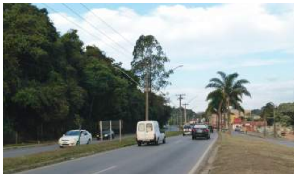
Principal via de acesso ao Sul de Minas / BH e RJ, na Av. Wenceslau Braz ocorrem muitos acidentes fatais