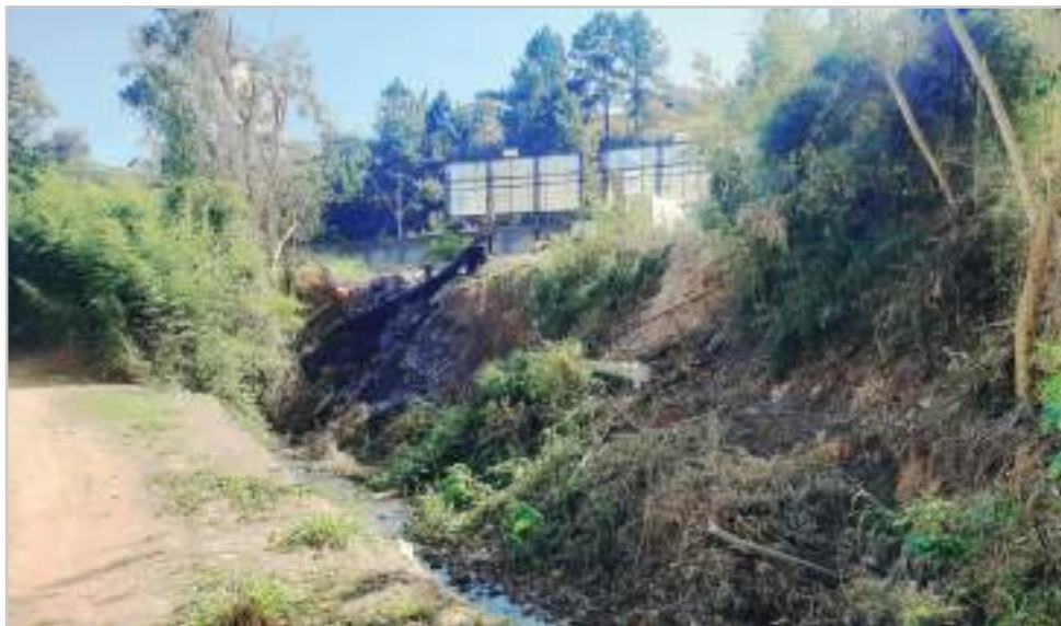
A situação mais perigosa, crítica e devastada do ribeirão da Serra está no bairro Dom Bosco