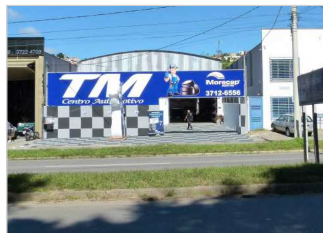
Novas instalações: Novos desafios, mais motivação