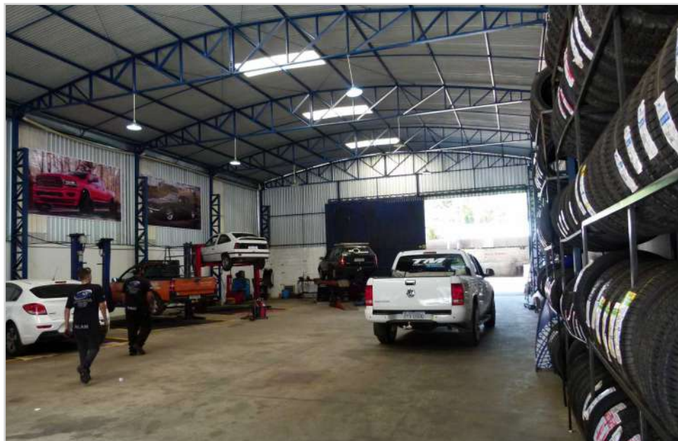
Mais conforto, segurança e comodidade: Amplo espaço vai permitir melhor atendimento

mais. Vocês podem ter certeza, podemos não ser a maior empresa do ramo, mas trabalhamos para ser a melhor”, finalizou o empreendedor.