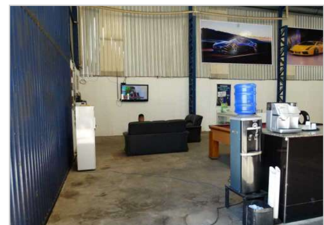
Espaço para espera para os clientes tem até mesa de bilhar